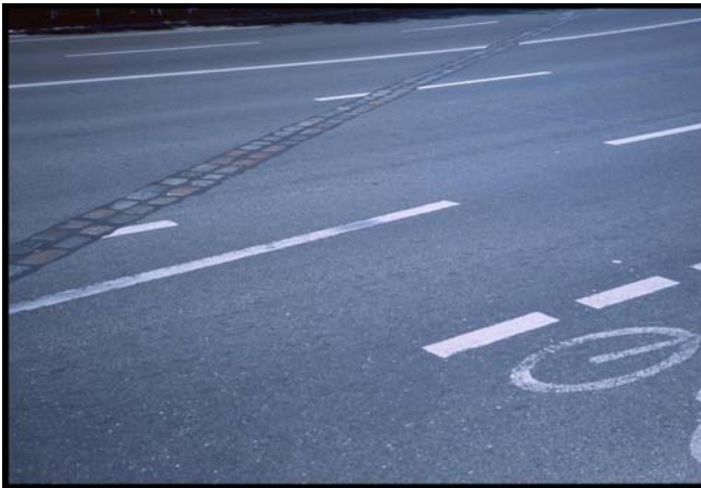
Te herinnering aan waar de muur heeft gestaan