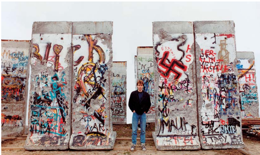
Verschillende overblijfselen van de muur